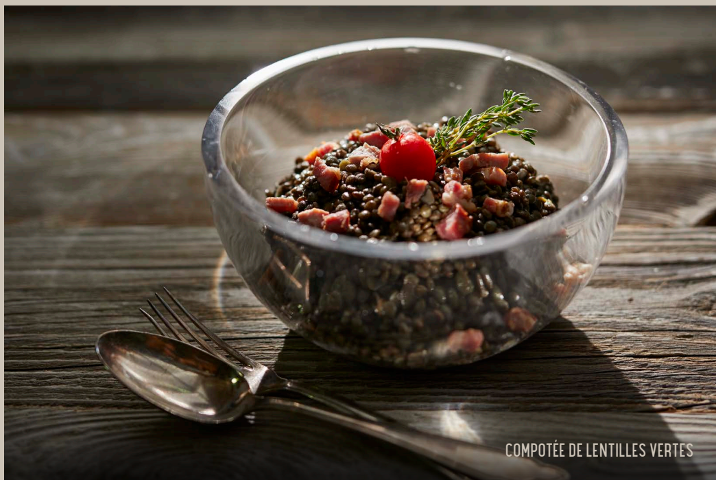
COMPOTÉE DE LENTILLES VERTES