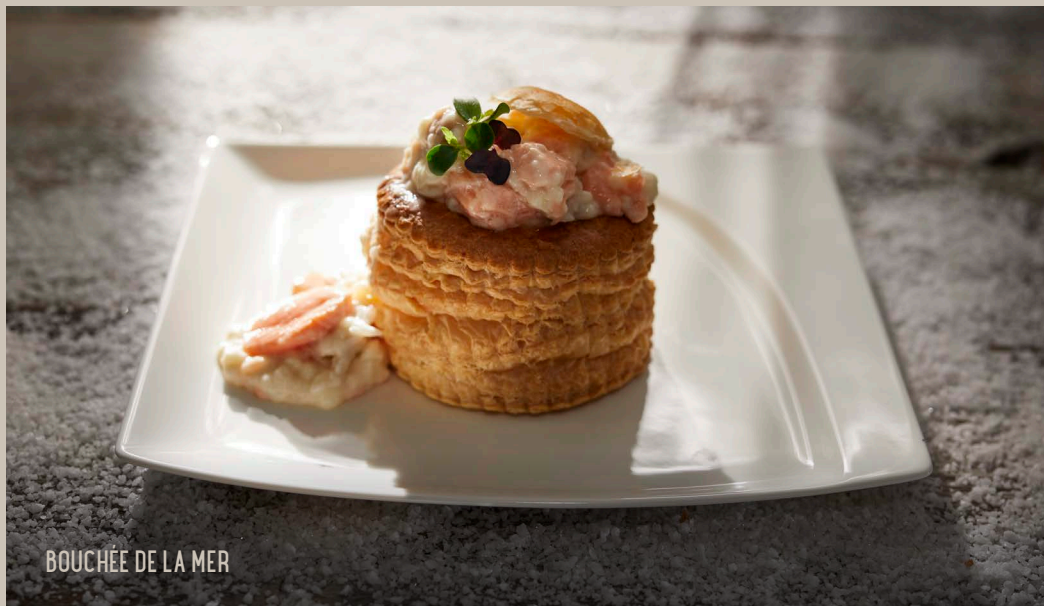
BOUCHÉE DE LA MER