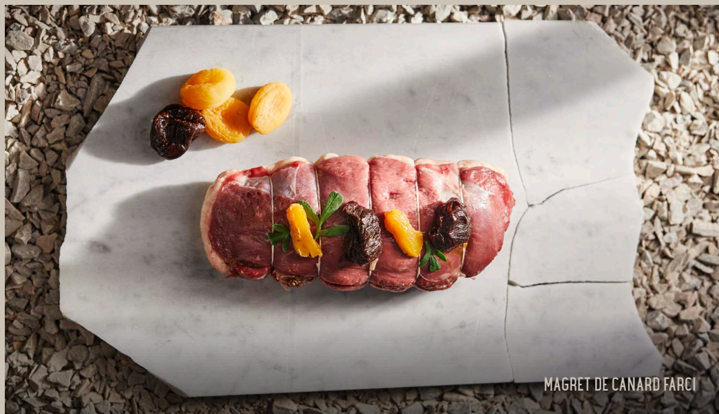
MAGRET DE CANARD FARCI

Épaule d'agneau désossée farcie de légumes, persil, ail, tomates séchées à l'huile et de tranches de jambon cru.