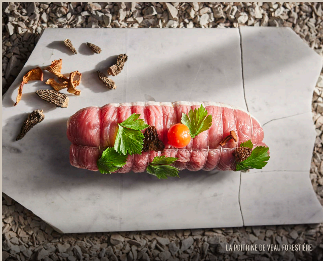
LA POITRINE DE VEAU FORESTIÈRE