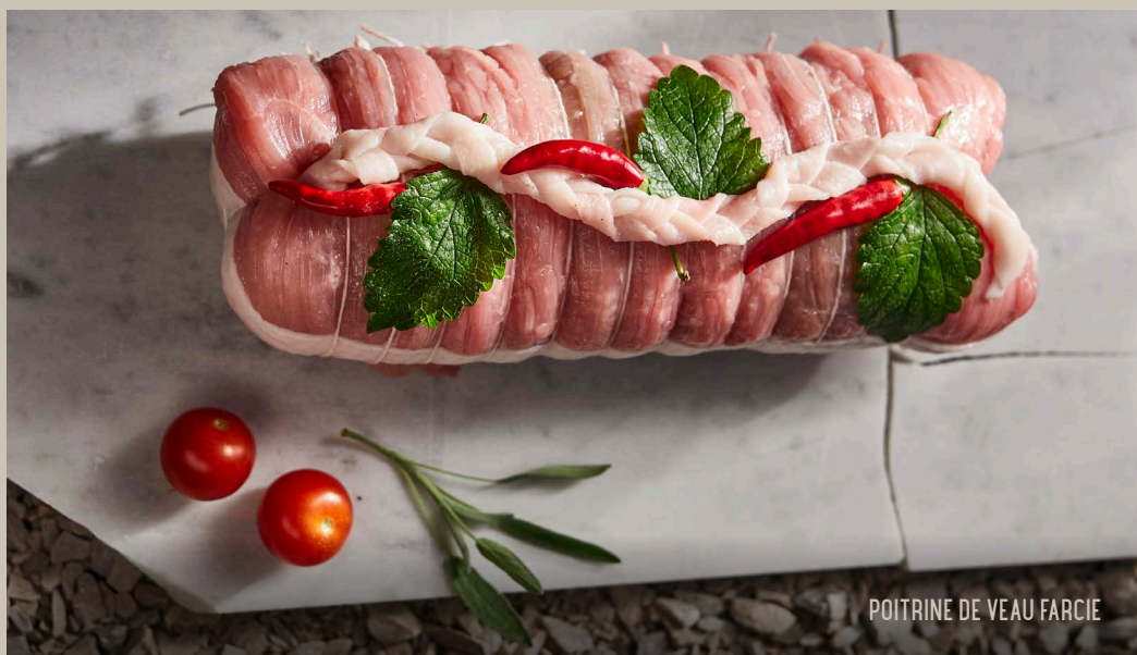
POITRINE DE VEAU FARCIE

Carré de veau désossé, emmenthal, jambon cuit braisé et fromage râpé.