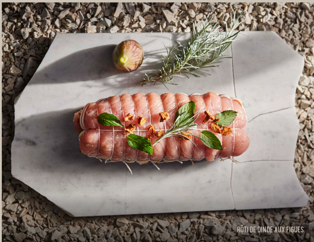
RÔTI DE DINDE AUX FIGUES