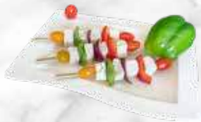
Brochette halloumi 4,60 € / pièce Réf. : 3574