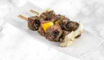
Brochette d'agneau 45,60 € / kg Réf. : 3515