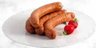
St.Gallener (Mettwurst + fromage) 28.20 € / kg Réf. : 3542