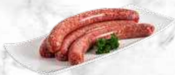
Saucisse à rôtir (Wainzoosis) 24.60 € / kg Réf. : 3722