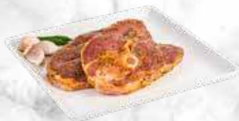
Tranche de gigot mariné 39,60 € / kg Réf. : 3546