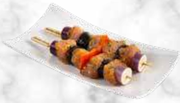
Brochette de dinde au gingembre 41,80 € / kg Réf. : 3507