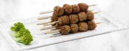
Brochette boulettes Köfte 36,60 € / kg Réf. : 3572