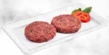
Hamburger 31,30 € / kg Réf. : 3711