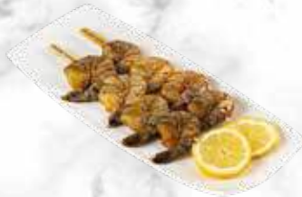
Sur commande Brochette de scampis 6,90 € / pièce Réf. : 3519