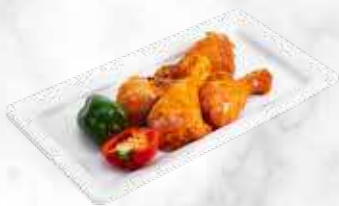
Pilons de poulet sunrise 18,80 € / kg Réf. : 3536