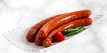
Merguez 28.40 € / kg Réf. : 3534