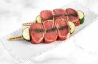
Brochette de mignon de porc 46,30 € / kg Réf. : 3521