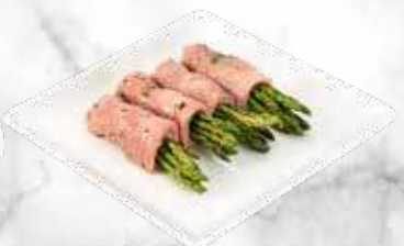
Roulé d'asperges 49,80€ / kg Réf. : 3571