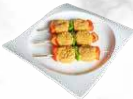
Brochette cordon bleu 29,00 € / kg Réf. : 3587