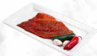
Steak de bœuf mariné 44,10 € / kg Réf. : 3545