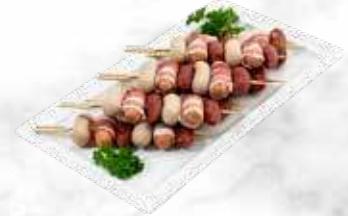
Brochette saucisses cocktail 34,30 € / kg Réf. : 3523