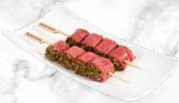
Brochette roulade de bœuf 37,50 € / kg Réf. : 3511