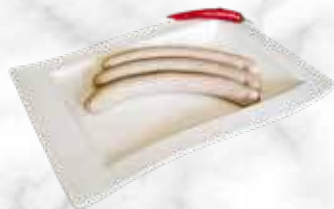
Saucisse jalapenos et cheddar 22.40 € / kg Réf. : 2419