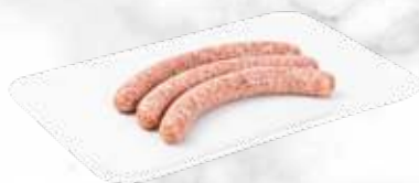
Wainzoosis de veau 33.70 € / kg Réf. : 3721