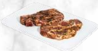
Grillcôtelette au vin 27,40 € / kg Réf. : 3531