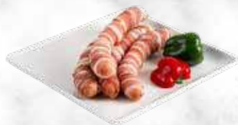
Blann Jang 33.30 € / kg Réf. : 3502