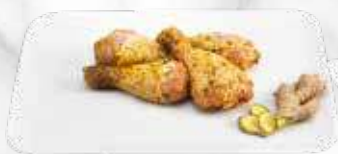
Pilons de poulet au gingembre 18,80 € / kg Réf. : 3547