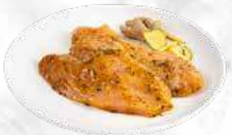
Escalope de dinde au gingembre 37,90 € / kg Réf. : 3528