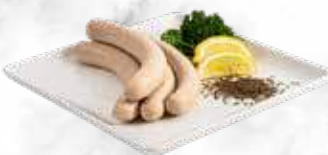
Two-Ringer avec cumin et persil 25.00 € / kg Réf. : 2401