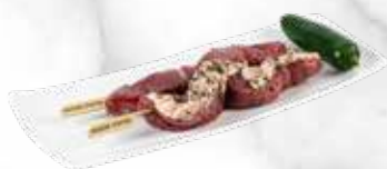
Brochette de canard 46,80 € / kg Réf. : 3517