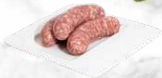
Salcicci 29.00 € / kg Réf. : 3720