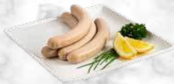
Two-Ringer sans cumin 25.00 € / kg Réf. : 2402