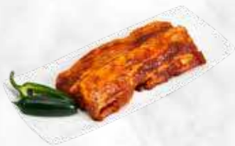
Grillspeck 22,50 € / kg Réf. : 3533