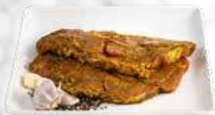
Grillcôtelette à l'huile 26,00 € / kg Réf. : 3529