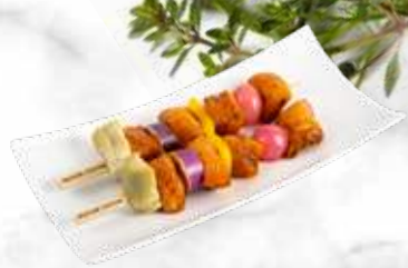
Brochette de poulet tandoori 41,80 € / kg Réf. : 3548