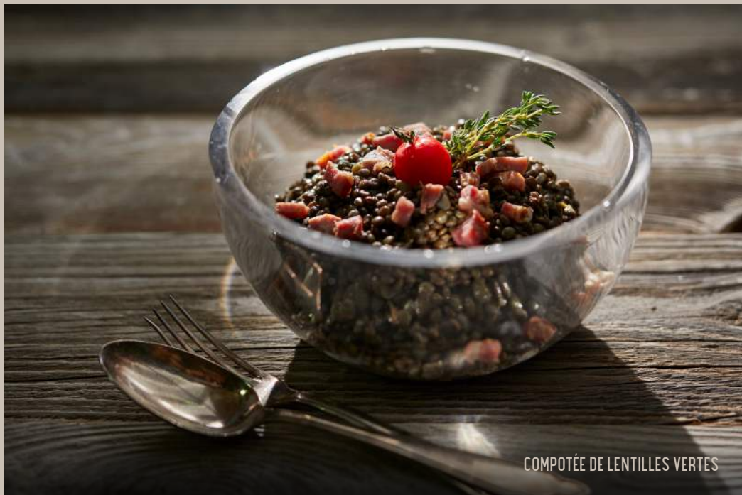
COMPOTÉE DE LENTILLES VERTES