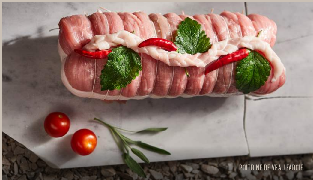
POITRINE DE VEAU FARCIE

Carré de veau désossé, emmenthal, jambon cuit braisé et fromage râpé.