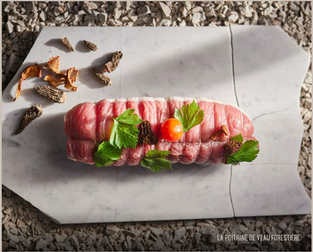
LA POITRINE DE VEAU FORESTIÈRE