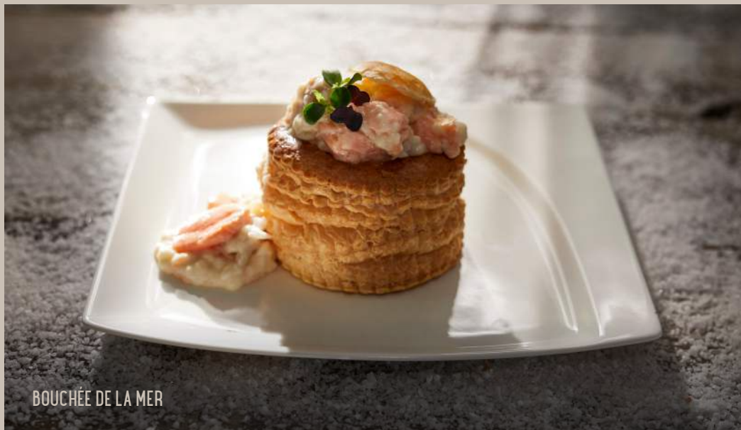
BOUCHÉE DE LA MER