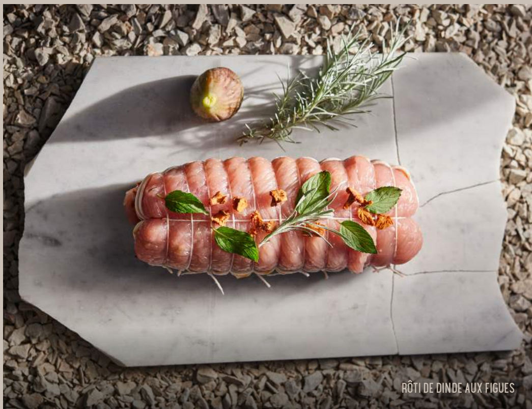
RÔTI DE DINDE AUX FIGUES